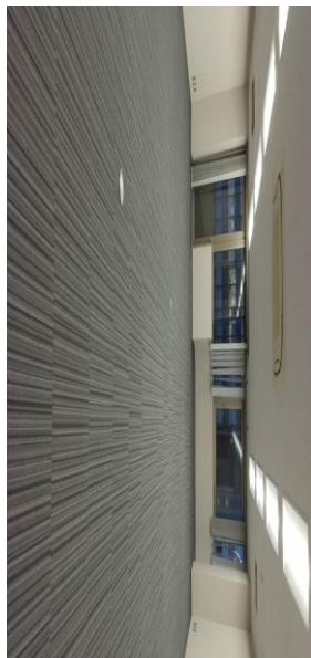
※図面と現況が異なる場合は現況を優先とします。